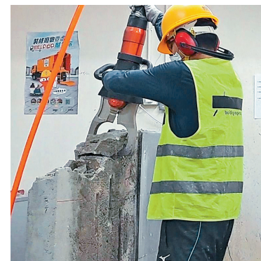
■工人採用「夾牆機」，利用壓力壓爆石屎，減少產生灰塵。