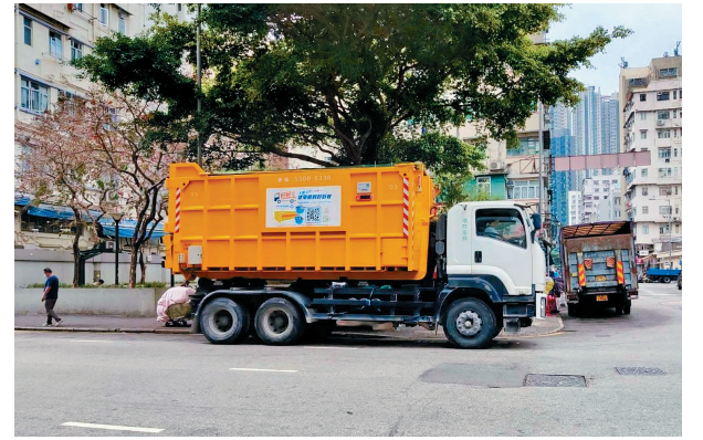
■環保署推出「好好斗」預約回收建築廢物服務。