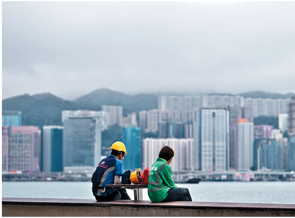
■環保裝修被視為可達致節能減碳的環球趨勢。

環保裝修可達致節能減碳，被視為環球趨勢，惟業界指本港在推行上仍未普及，當中住宅樓宇及商廈裝修所衍生的噪音、灰塵及廢物備受關注。近年有團體推動「環保裝修約章」，盼帶動新風氣，惟市民及物管人員普遍缺乏對環保裝修概念的認識，中小型裝修公司憂慮增加成本，加上工人學習新技術的意欲不高，令推展停滯不前。有工程師建議，當局為採用環保裝修的工程公司提供補貼，另就綠色貸款作利息優惠，並鼓勵屋苑法團協助，一起推動環保裝修。