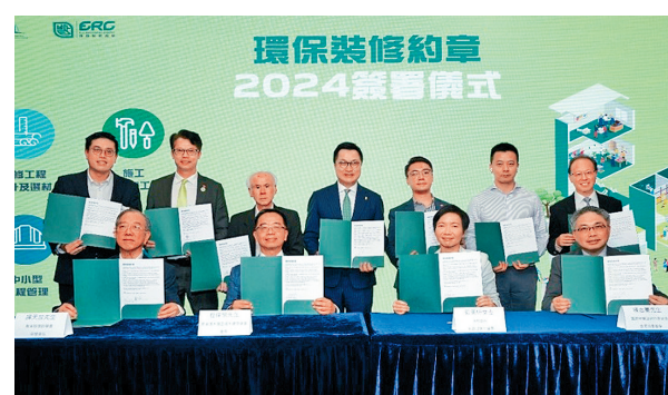
■現時有逾100間公司響應簽署《環保裝修約章》。

針對裝修噪音及灰塵，環保署推出「寧靜裝修先導計劃」，協助物管人員制訂守則和技術支援，編製《寧靜裝修管理指引》及《寧靜裝修設備指引》，提供相關設備的使用方式及供應商名單。就工友反映環保裝修工具昂貴，環保署由2021年推出「借用寧靜裝修設備服務」，鼓勵業界採用較環保的寧靜裝修設備，並舉辦示範及講座，至今借出逾100部相關工具，希望長遠取代傳統工具。