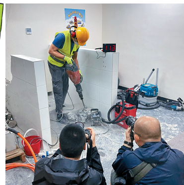
■工人使用傳統機器時，會產生大量噪音及灰塵。

勞聯機電業工會聯合會主席張永豪亦指，環保署近年有向業界借用降塵及減污染的新工具。他指，裝修工程中拆牆及於牆壁鑽孔，產生大量噪音及灰塵。有工友稱，曾向署方借出俗稱「夾牆機」的「油壓夾」工具，該工具利用壓力夾爆石屎牆，有別於撞擊式方法，相對產生較少噪音及灰塵，但他引述工友指該機器重達數十磅，